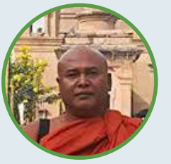
ဦးပဏ္ဍိတ

ဘီးယုံဘုရားဖူးအဖွဲ့နဲ့ နောက်ထပ်သွားမယ့်သူတွေကို ပြောချင်တဲ့ သတင်းလေး ခရီးစဉ်ရက်ရှည်သွားတာတောင် မငြီးငွေ့ရအောင် တရားဟောတဲ့ ဂိုက်ဆရာတော်လေးနဲ့ တိုးလီဒါ ကိုနေထွန်းတို့ ကြောင့်နောက်တစ်ခေါက် သွားဖို့ ရှိရင် သူတို့ ရှိတဲ့ ဘီးယုံဘုရားဖူးအဖွဲ့ နဲ့ပဲသွားမယ် ။